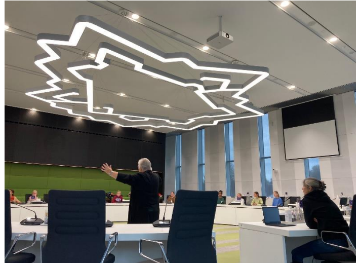
Scholieren in de raadszaal van de gemeente Woerden.