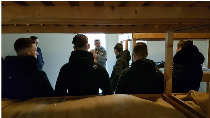
Eén van de programmaonderdelen is een bezoek aan het Nationaal Monument Kamp Vught.

De dag begint met een groepsinterview over de vraag: Hoe kunnen supporters de club versterken. Aan de orde komen thema's als: (voetbal)clubliefde, de positieve rol supporters maar ook (wan)gedrag in en rond stadion en we benoemen thema's als racisme, discriminatie, buitensluiten en Antisemitisme. Eén voor één komen de supporters aan het woord. De sfeer is goed en na wat lacherige momenten worden de gesprekken opener en proberen we te reflecteren op de eigen positie van de deelnemers. Er zijn spelregels voor voetballers, wat zijn de regels voor de supporters in het stadion? Wat zijn de factoren die gedrag beïnvloeden? In hoeverre speelt groepsdruk een rol? Op welke momenten hebben supporter een keuze? En wat is er nodig om het in de toekomst anders te gaan doen?