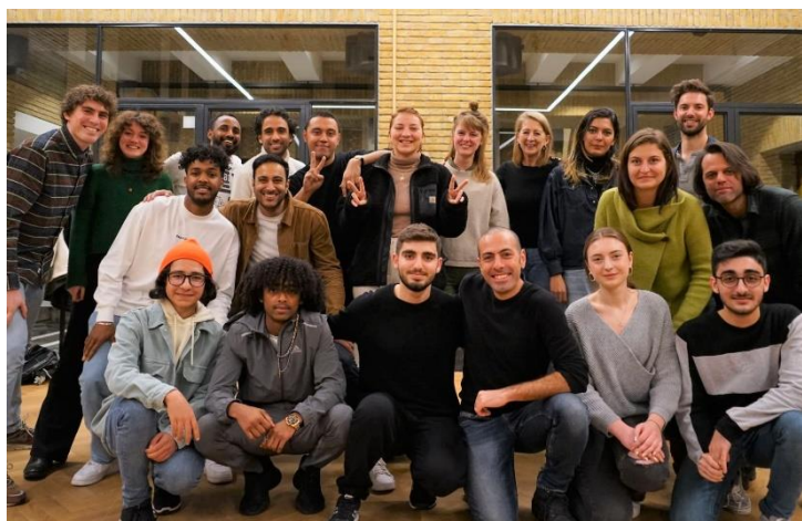
Het team filmdocenten bijeen in Utrecht voor een workshop over vrijheid. Meer info: Over ons – Common Frames

Bekijk de beelden: POLITICAL FUN FAIR Super Wal Kiermes Luxembourg - YouTube