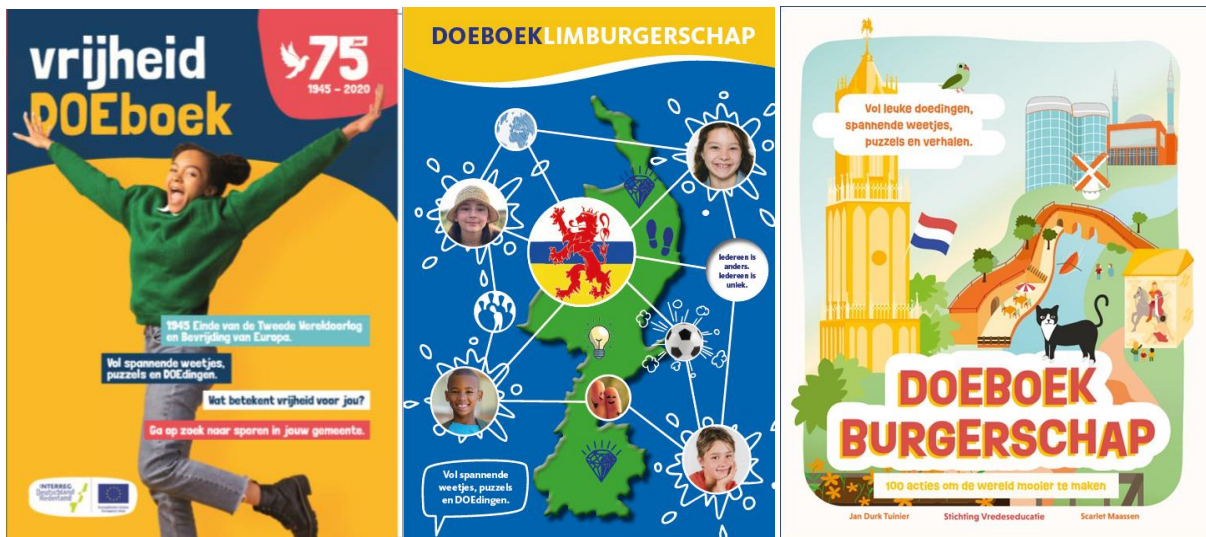
Doeboek Vrijheid in 2019 en DOEboek Limburgerschap in 2020. Rechts: cover DOEboek Burgerschap, uitgave in april 2022.