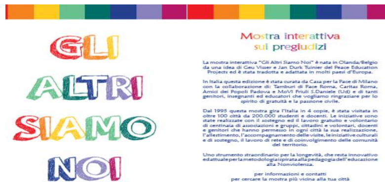
Cover van de publicatie van OSCE – ODIHR (links) en de colofon van de Italiaanse tentoonstelling gebaseerd op de Nederlandse Vredeseducatie en uitgebracht door 'Casa per la pace Milano' (rechts).