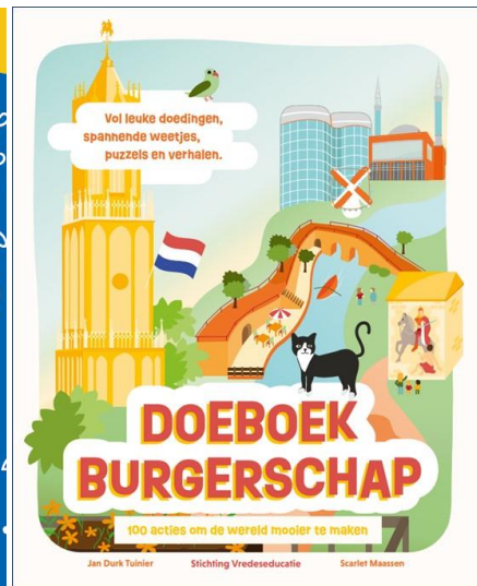
Doeboek Vrijheid in 2019 en DOEboek Limburgerschap in 2020. Rechts: cover DOEboek Burgerschap, uitgave in april 2022.