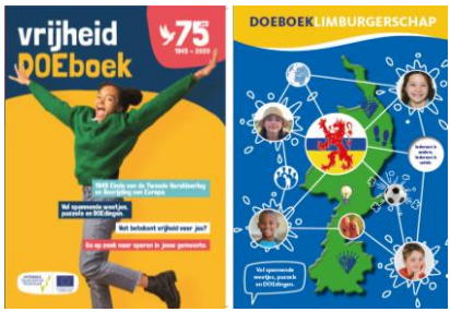
DOEboek Vrijheid en DOEboek Limburgerschap

Stichting Vredeseducatie Peace Education Projects